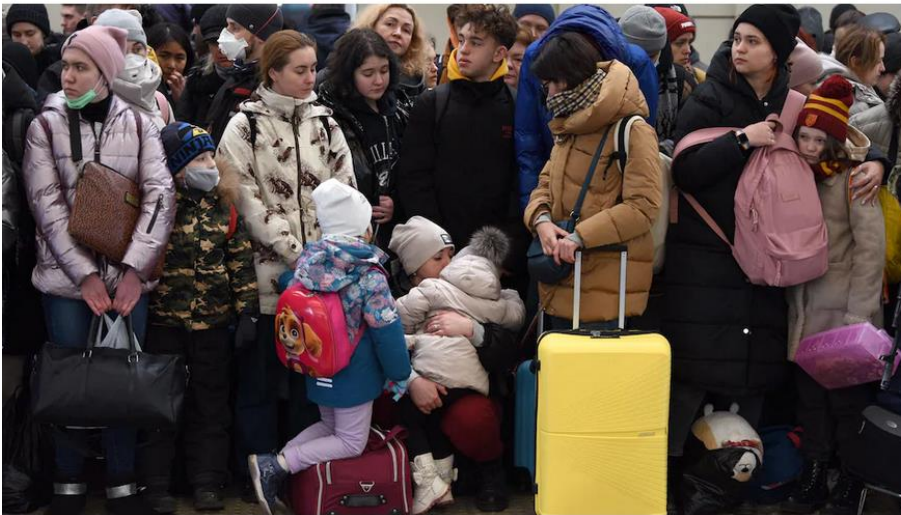
Des réfugiés attendent un train pour la Pologne à la gare de la ville de Lviv, dans l'ouest de l'Ukraine.